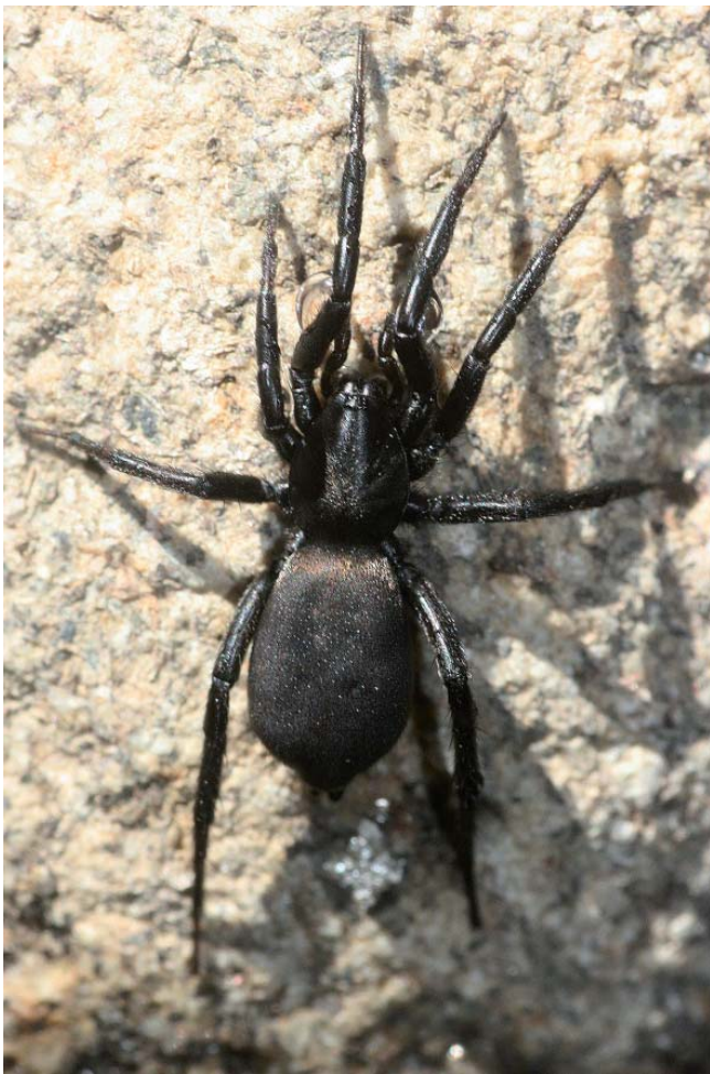
Zelotes egregioides

Découverte à Betpouey (65) à 1650 mètres d'altitude par deux naturalistes du Conservatoire d'Espaces Naturels de Midi-Pyrénées pendant un inventaire dans le cadre de l'Atlas de la Biodiversité des Communes (ABC), elle se prénomme « Zelotes egregioides ». Elle mesure entre 5,5 et 6 millimètres de long, est entièrement noire et vit essentiellement la nuit. Elle capture ses proies en les traquant au sol, sans tisser de toile. L'espèce a été auparavant observée en Espagne et au Portugal. D'autres espèces récemment découvertes restent à publier. Cette découverte montre s'il en est besoin la richesse de la biodiversité pyrénéenne dont il reste encore beaucoup à connaître et à comprendre pour mieux la préserver.