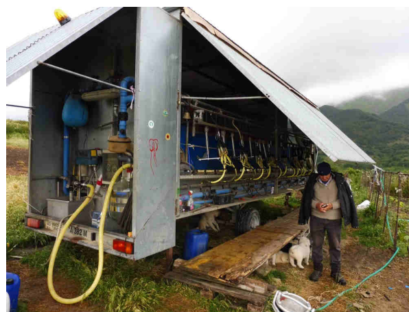
Installation de traite mobile

L'un des éleveurs rencontrés est emblématique des transformations en cours : âgé, il conduit encore en été 350 brebis sardes en montagne où il fabrique le pecorino avec des installations légères (traite mobile sur remorque, fromagerie dans un caisson de camion frigo)... mais son fils installe un atelier hors-sol de 250 Lacaune dans la plaine du Latium, pour livrer le lait à un industriel.