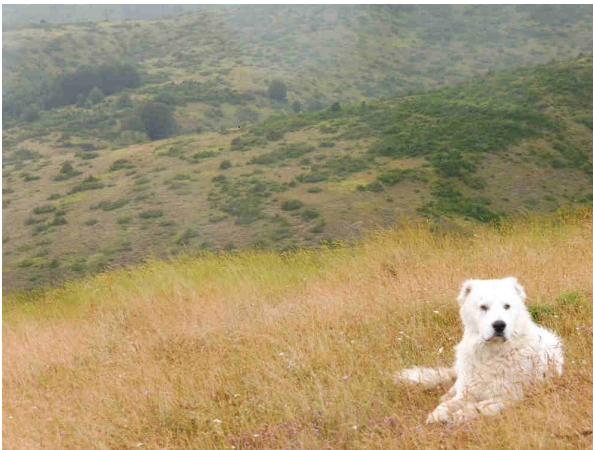
Faible pression de pâturage et fermeture des milieux à 1500 m dans les Abruzzes

Ces bouleversements se lisent aussi dans les paysages de Molise et des Abruzzes, qui se sont très fortement boisés en 40 ans en moyenne montagne (500 à 1000 m) par des accrus de feuillus (on est en montagne méditerranéenne bien arrosée, aux dynamiques de végétation rapides) : mes interlocuteurs me montrent des paysages entièrement fermés et me disent qu'ils les ont connus ouverts, cultivés et pâturés dans leur enfance, c'est-à-dire il y a une quarantaine ou une cinquantaine d'années. En plus haute montagne vers 1500 m, les dynamiques de fermeture des milieux ouverts, plus lentes, sont enclenchées avec des faibles pressions de pâturage parfaitement identifiables.