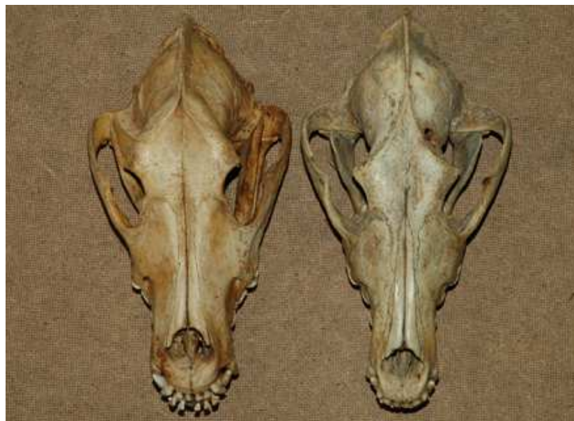
Fig. 1 : Photo de crânes vus par dessus : chien (race beauceron, 40kg) à gauche et de loup (environ 30kg) à droite.