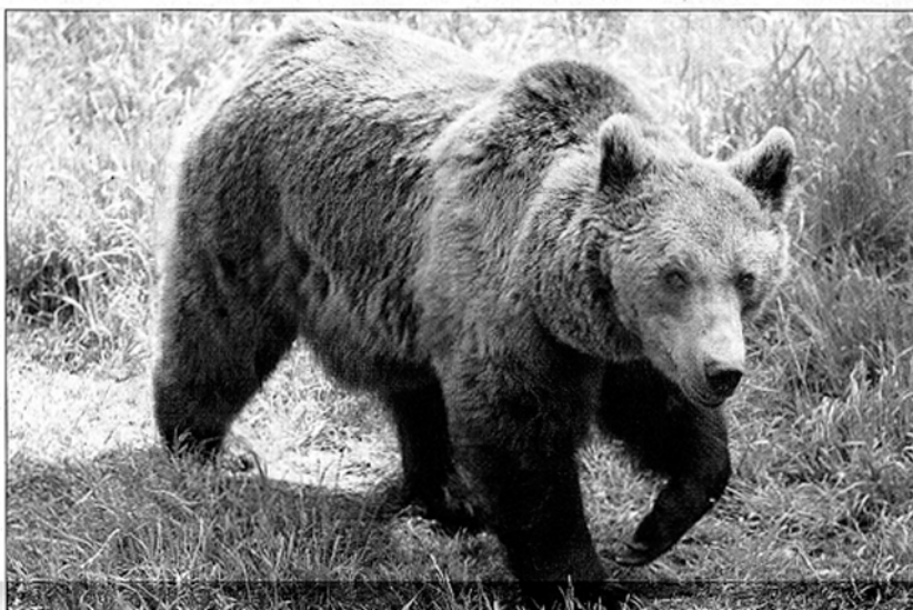
LES ANGLÉS (PYRÉNÉES-ORIENTALES), LE 24 JUIN 2006. Les éleveurs en ont assez que les ours attaquent leurs troupeaux et souhaitent une intervention rapide de l'Etat.