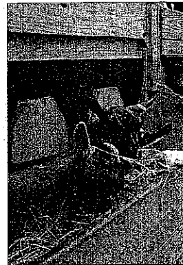
« Bienvenue à la ferme » participe à cette

Pour financer les projets, Frédéric Nihous propose la création d'un fond d'initiatives rural et d'accompagnement territorial