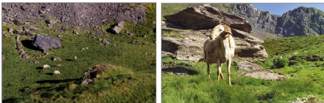
Détail de 2 = le bas du pierrier (1900 m.) et la partie basse des crêtes (2100 m +/-). A gauche, quelques brebis pâturent dans la combe. A droite, jeune bélier castillonnais sur le mamelon d'où je prends le cliché précédent.

« Ces pâtres espagnols ne font ni beurre, ni fromage, mercenaires aux gages de riches propriétaires de l'Aragon, ils conduisent en nomades d'innombrables troupeaux de moutons élevés particulièrement pour leur laine, quelques vaches pour faire des élèves /= des veaux, que leur mère élève en les faisant têter/, des juments avec leurs poulains, des chèvres enfin dont le lait sert à leur nourriture avec de très beaux pains de leur pays et la chair des moutons qui se précipitent ça et là du haut des rochers. /.../ Les bergers français /.../ perdent bien moins de bétail parce qu'ils en ont moins et les conduisent moins haut /.../. »