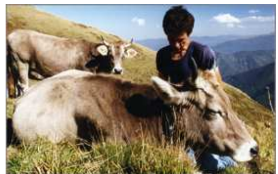
Hommes, bétail, montagne, inséparables et calmes

Face aux enjeux du nouveau millénaire, réduire ce bilan au seul « ours », même devenu cause nationale semble-t-il, serait singulièrement réducteur, aux antipodes de la façon dont, pour nous limiter à lui, le récent Grenelle de l'Environnement a posé les problèmes dans leur complexité, avec toutes les incertitudes aussi de nos savoirs face aux défis de ce millénaire.