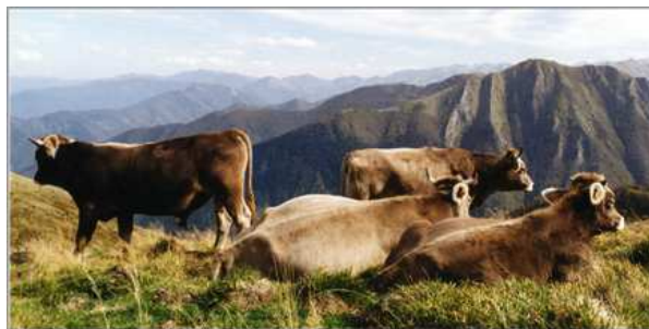
Début d'automne pour la race Brune des Pyrénées en crête, calmes, seuls, tranquilles, elles et ils profitent