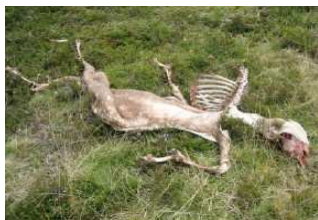
Attaque imputable à l'ours – été 2007

A l'inverse, les modes d'utilisation agro-pastoraux du milieu pyrénéen se situent dans des logiques différentes, à la fois héritage de méthodes séculaires et résolument redevenues modernes parce que « durables ».