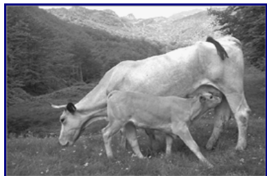
Début d'été pour cette vache race Gasconne et son veau à l'étage intermédiaire

Modifier ce système, c'est menacer directement les races autochtones sur lesquelles il s'appuie, en totale contradiction avec la Charte du Bureau des Ressources Génétiques Français : « la gestion à long terme des races à petit effectif est /.../ un enjeu majeur pour gérer durablement l'agrobiodiversité au sein des territoires /.../ ressources gérées dans leur milieu traditionnel de culture ou d'élevage qui, de fait, constitue la base génétique du champ couvert par l'agrobiodiversité » .