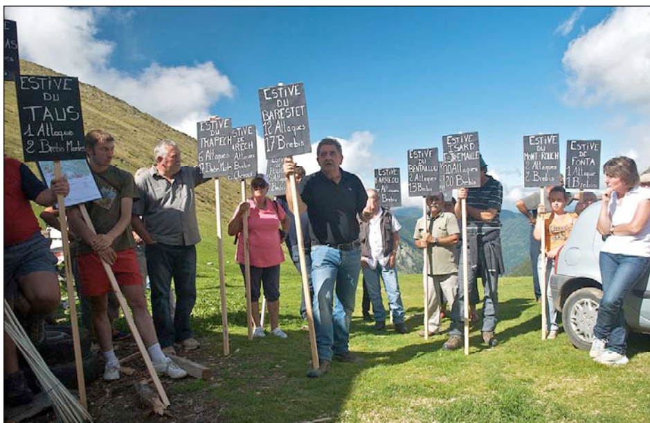
Toutes les estives étaient présentes avec un panneau indiquant les dégâts

C'est bien un enjeu global d'aménagement du territoire que les éleveurs couserannais sont venus défendre à Arréou.