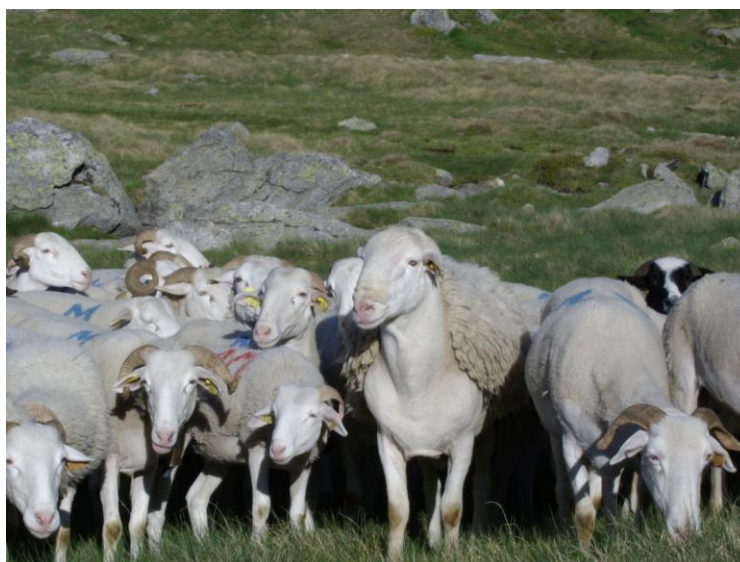
Brebis tarasconnaise, plein été