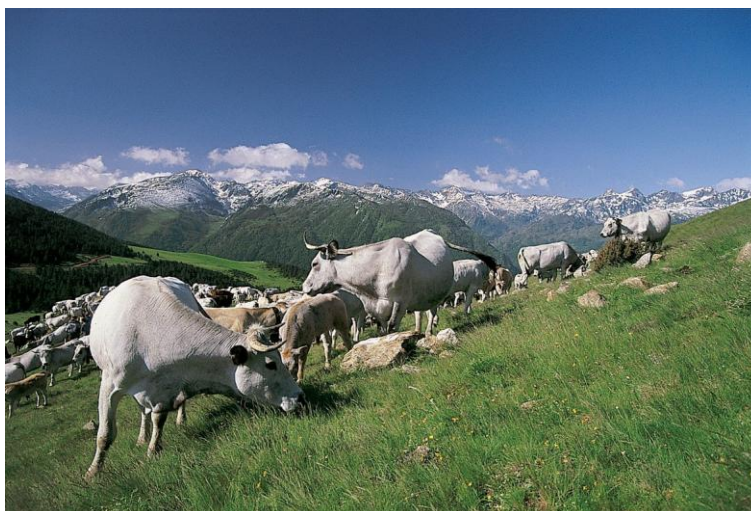
Vaches gasconnes, début d'été