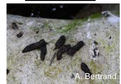
Crottes de Desman