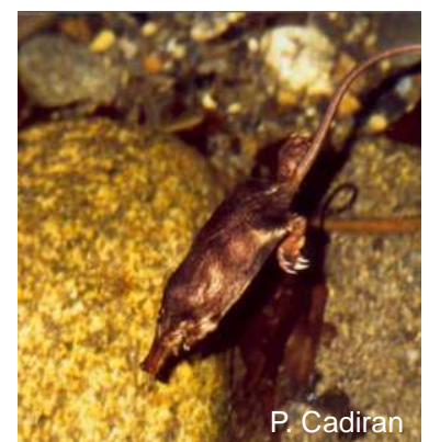
Desman en plongée