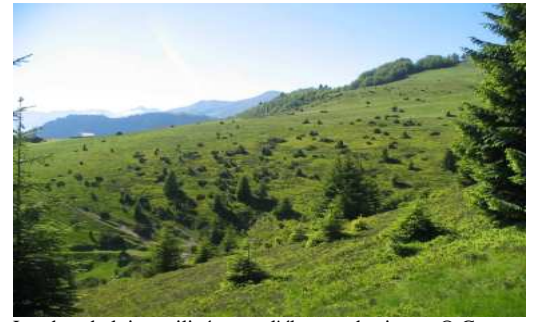
Lande subalpine utilisée pour l'élevage des jeunes

Ces milieux présentent des intérêts écologiques, sylvicoles, touristiques, cynégétiques et agricoles et sont le siège de multiples activités qui lorsqu'elles ne tiennent pas compte des besoins et des sensibilités du grand tétras peuvent être préjudiciables à l'espèce.