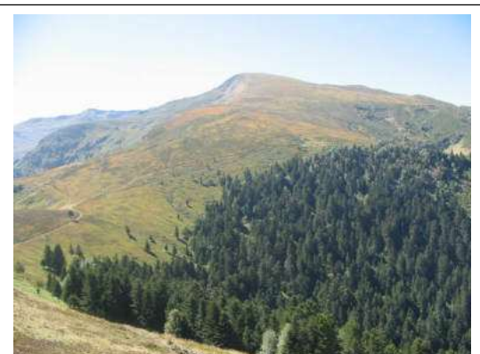
Zone d'hivernage