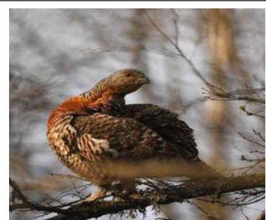
Poule de grand tétras