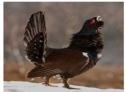
Coq de grand tétras en parade

Cet oiseau est le plus gros oiseau des forêts d'Europe : environ 4-5 kg pour le coq et jusqu'à 2,5 kg pour la poule. Oiseau caractéristique de la taïga boréale et des forêts d'Europe centrale, il a trouvé refuge en France dans les forêts des étages montagnards et subalpins..