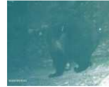
Balou (patte avant droite levée)

Peut être pour se rapprocher des femelles ... ?