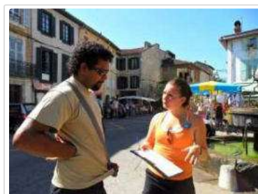
Les bénévoles de Parole d'ours en action sur un marché pyrénéen