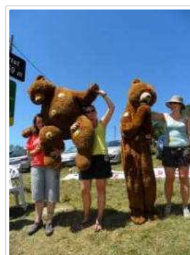
Les bénévoles de Parole d'ours sur le Tour de France