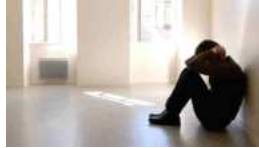
Plaintes pour viol : les victimes continuent de...