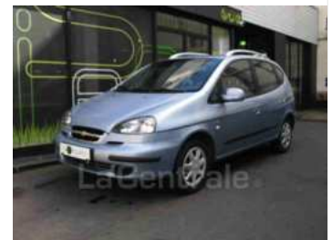
CHEVROLET REZZO - 4990 €