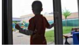
Autisme : une réplique censurée dans un...