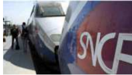
Un cadre de la SNCF "au placard" : c'est...