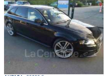
AUDI S4 - 29500 €