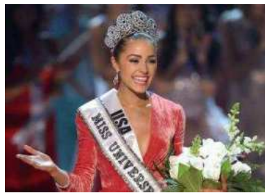
L'Américaine Olivia Culpo, 20 ans, a été élue le 19 28 décembre miss Univers 2012 à Las Vegas, décrochant le titre pour la première fois depuis 15 ans pour les USA. (+)