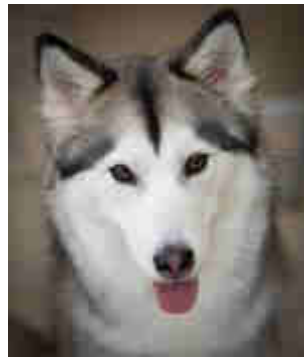
Husky de Sibérie

L'homme a domestiqué le chien avant tout autre être vivant, animal ou végétal. Sur les cinq continents, le chien fait partie de l'histoire des sociétés humaines. Mais où et quand a commencé le processus qui a transformé le loup, prédateur sauvage, en compagnon universel de notre espèce? La question fait l'objet d'une controverse scientifique ouverte par Charles Darwin, et qui n'est toujours pas close.