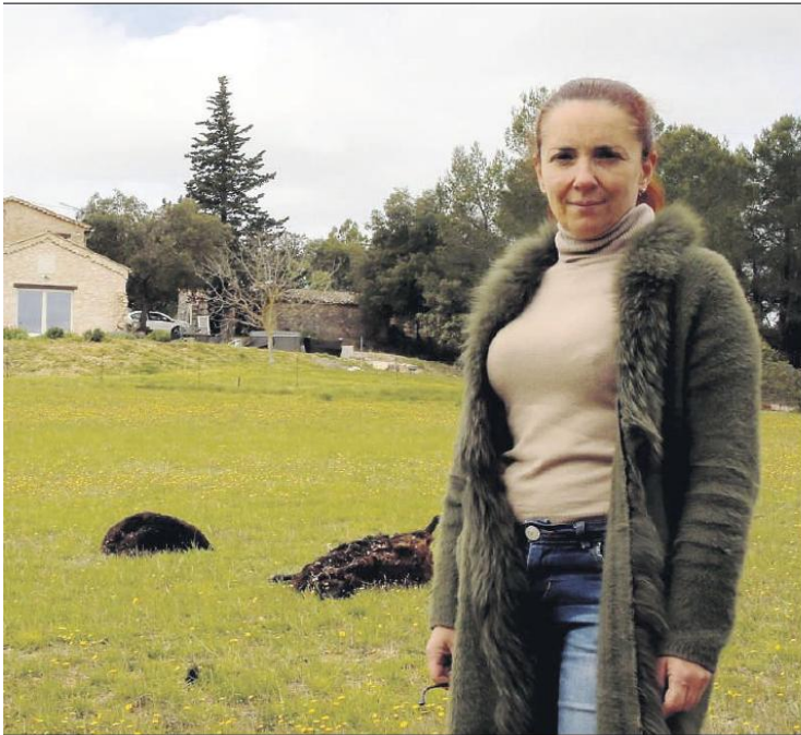
La Jensarde regroupe de nombreuses habitations. De sa terrasse, à quelques dizaines de mètres, on voit les moutons.