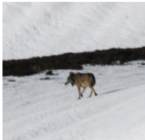
Loup du cantal (Photo : G. Devaux et D. Demolie ©, nos remerciements aux auteurs)