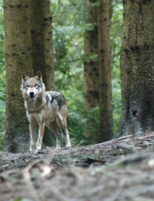
Un louveteau folâtre sous l'œil attentif de sa mère