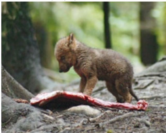
Les loups sont carnivores dès leur plus jeune âge