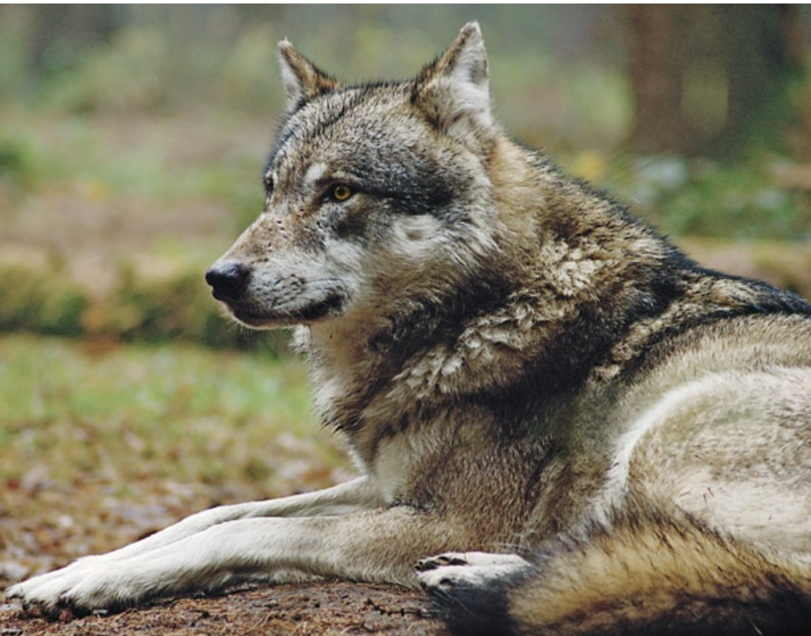
Le loup est l'ancêtre du chien. La ressemblance est frappante, surtout avec certaines races

Pour plus d'informations, voir www.protectiondestroupeaux.ch ou www.gruppe-wolf.ch (en allemand seulement)