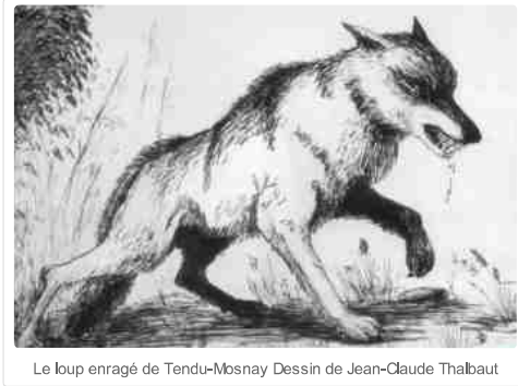
Le loup enragé de Tendu-Mosnay Dessin de Jean-Claude Thalbaut

En France , De Beaufort recense environ 200 cas de rage transmise par les loups aux humains depuis le Moyen Age. En 1675, un loup enragé cause la mort de 3 personnes aux Hayes, près de Montoire, dans le Loiret. En hiver 1718, dans la région de Toulouse, une jeune bergère mordue par un loup enragé meurt 11 jours plus tard. Le 26 novembre 1726, 22 personnes sont blessées par un loup enragé à Neung sur Beuvron, près de la forêt d'Orléans : 9 décédèrent. En hiver 1731, près de Bordeaux, 4 hommes furent attaqués : 1 seul survécut. En février 1746, à Meynes, 22 personnes sont mordues. En 1762, c'est une louve enragée qui mord 14 personnes (8 d'entre elles ne survivront pas) dans les bois de l'abbaye de Fontevault. Entre 1811 et 1825, dans l'Yonne, les loups enragés transmissent la maladie à quelque 60 personnes. En juillet 1878, un loup enragé sème la terreur sur les communes de Tendu et Mosnay (Indre) : 7 personnes et 50 animaux domestiques furent mordus ; 2 des personnes moururent de la maladie un mois après.