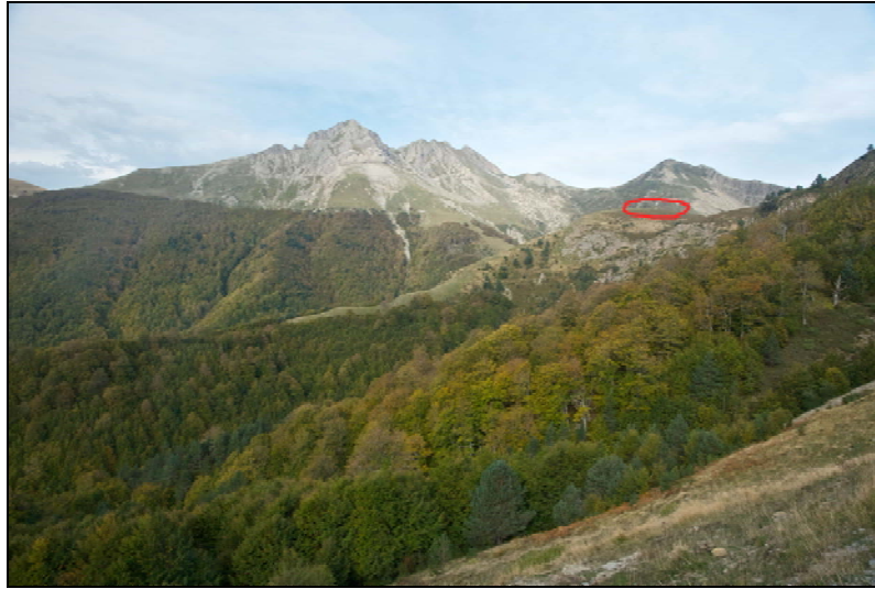
Cercle rouge : vu du versant navarrais, la butte où l'ours a attaqué