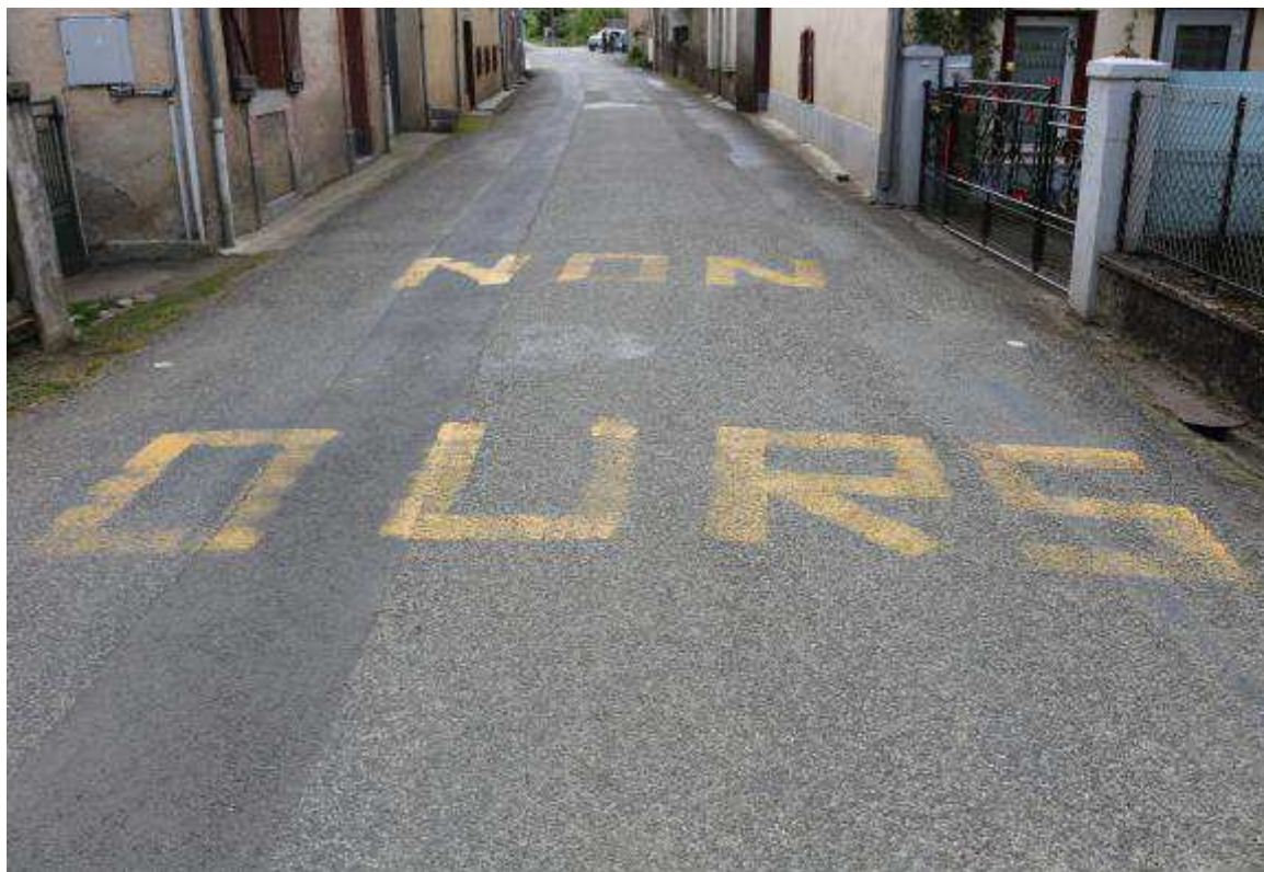
Le refus de l'ours s'affiche sur les routes du Couserans (Ariège), le 14 mai 2014.