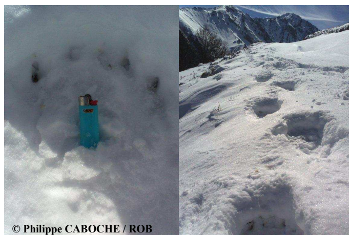
Piste d'un ours mâle découverte lors d'une randonnée en ski sur la commune de Bonac Irazein (09).

Les documents photographiques obtenus ont permis de détecter 5 mâles adultes minimum. Une vidéo de Pyros datant du 31 octobre 2013 (récoltée en février 2014) le montre, en comportement de marquage, urinant au pied d'un arbre équipé d'un appât térébenthine.