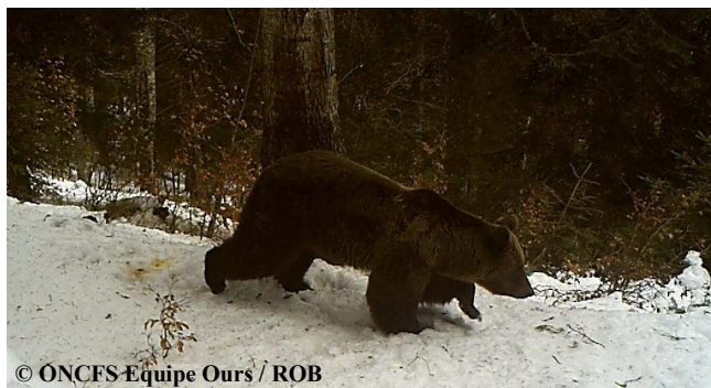
Extrait d'une vidéo automatique réalisée, le 29 mars 2014, sur la commune de St Lary (09).