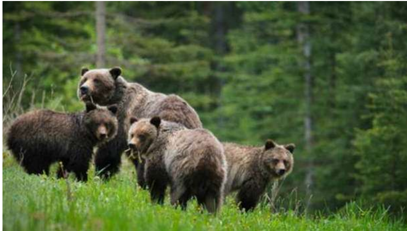
Une ourse grizzly avec ses petits (archive)

Mise à jour le mardi 5 mars 2013 à 14 h 37 HNE