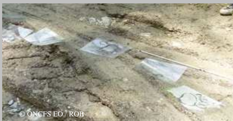
Sur une piste d'ours, faire un maximum de relevés (dessins d'empreintes et mesures au pied à coulisse).

Ce mois de juillet n'a pas encore permis de détecter la présence de femelle suitée, ce qui n'est pas anormal au vu des observations de ces dernières années. En revanche, dans les Pyrénées centrales, les mâles adultes se sont montrés particulièrement actifs, notamment Balou qui fut photographié sur Melles et 5 jours après sur Couflens (33 km à vol d'oiseau).