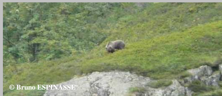
Observation visuelle d'un ours indéterminé faite le 28 Août 2013 à 15h00, commune de Couflens (09).