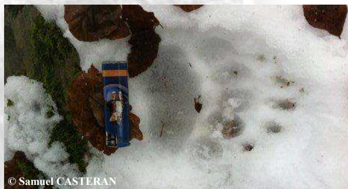
Photo d'empreinte d'une patte avant gauche