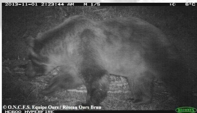
Photo automatique d'un ours adulte mâle, le 1er novembre 2013, commune de Melles (31).