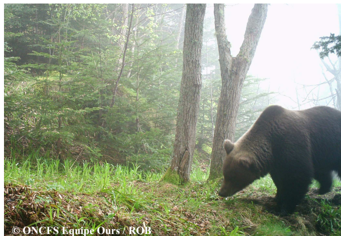
Photo automatique de Cannellito (probable), le 07 mai 2014, sur la commune d'Estaing (65).

Les documents photographiques obtenus ont permis de détecter 5 mâles adultes minimum ainsi que l'ourse Hvala qui s'est séparée de ses jeunes nés en 2013. Il est à noter qu'une photo automatique de cette dernière, déjà en compagnie de Pyros, a aussi été relevée mi-avril par nos collègues du Val d'Aran.