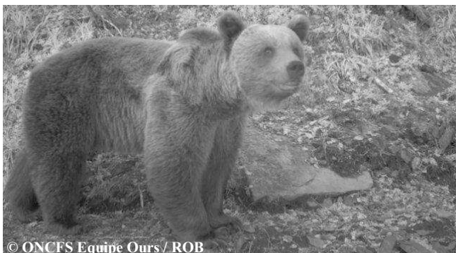
Photo automatique d'un ours mâle adulte, le 23 mai 2014, sur la commune de Sentein (09).