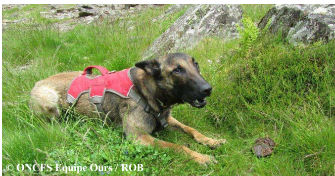
Iris à l'entraînement, marquant une crotte d'ours.

Le 21 août vers 10h30, une ourse et ses 2 oursons ont été vus par un berger sur la commune de Seix (09). L'observation a été réalisée à 30/40 mètres de distance alors que les ours consommaient une brebis. Surpris par le berger à cause du relief et du vent qui leur étaient défavorables, les 3 ours se sont dressés afin de mieux l'identifier et, après un grognement d'alerte de la mère, se sont enfuis en direction du couvert forestier. Les poils collectés sur le lieu de l'observation devraient nous permettre d'identifier ces trois individus. Deux jours avant, dans le même secteur, d'autres indices (empreintes, couches, poils et crottes) ont aussi été relevés lors d'un constat de dommage à proximité d'une brebis prédatée. 8 crottes dont 6 d'oursons ont notamment été collectées. Iris, notre chienne (Berger Belge Malinoise), en cours de formation pour la recherche d'excréments d'ours, a ainsi pu mettre en pratique avec succès tout l'enseignement qui lui a été prodigué.