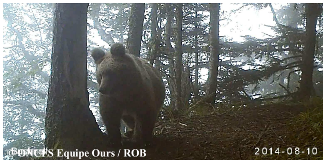
Extrait d'une vidéo automatique d'un ours de 1,5 an, le 10 Août 2014 à 08h39, commune de Melles (31).