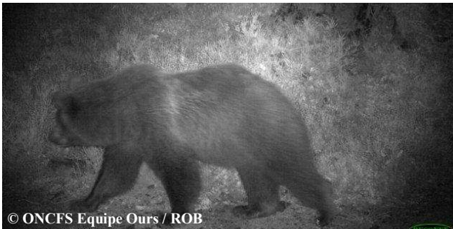
Photo automatique d'un ours indéterminé, le 06 septembre 2014 à 23h40, commune de Melles (31).