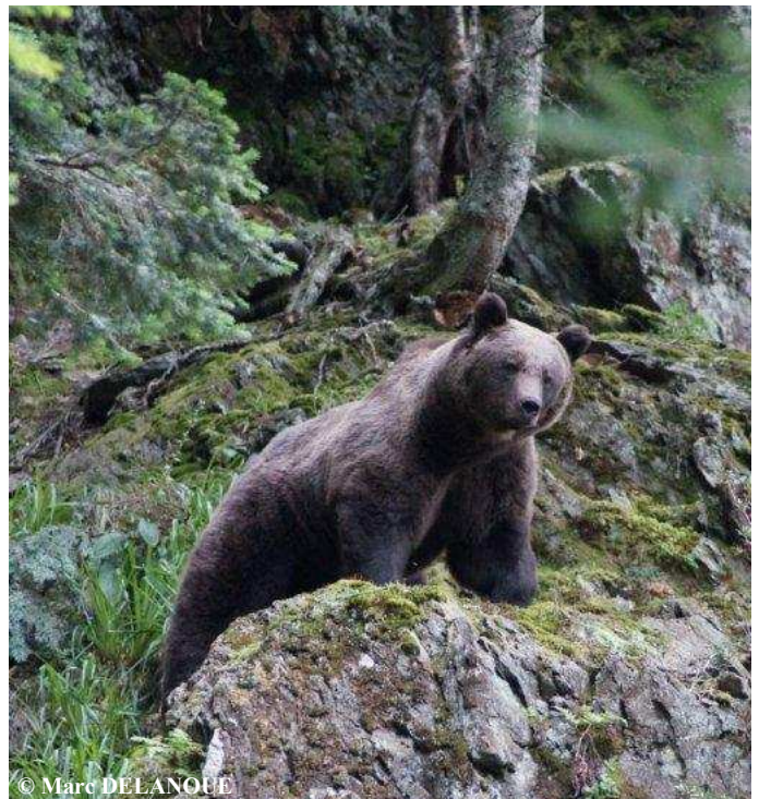
Ours mâle adulte, le 21 septembre 2014, à 10h00, commune de Melles (31).

Les documents photographiques obtenus ont permis de discerner 2 individus différents dont 1 subadulte né en 2013.