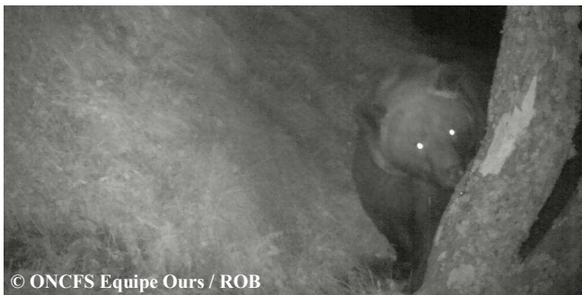
Photo automatique d'un ours mâle adulte, le 21 septembre 2014 à 01h38, commune de Sentein (09).