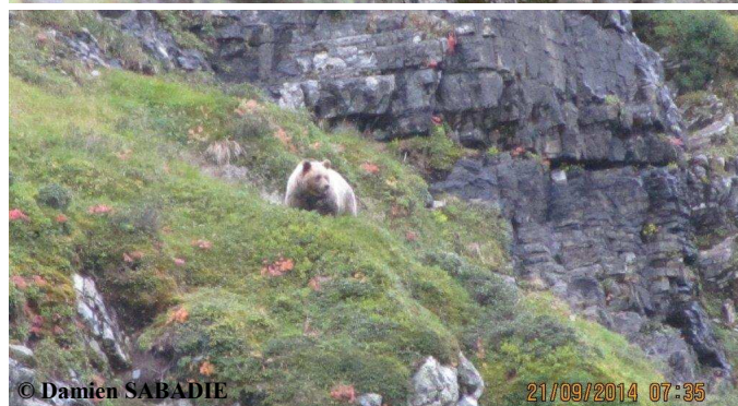
Ours adulte indéterminé, le 21 septembre 2014, à 07h29 et 07h35, commune d'Ustou (09).