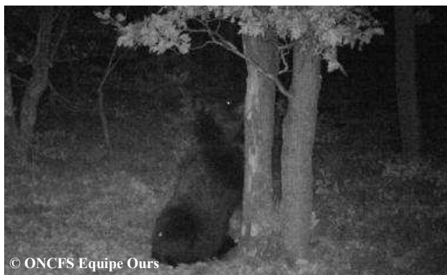
Photo automatique de l'ours Cannellito, le 31 octobre 2015, dans une chênaie de la commune de Luz St Sauveur (65).