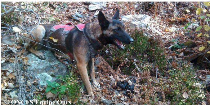
Chênaie d'altitude utilisée par l'ours pour se nourrir et Iris au marquage d'une crotte d'ours le 27 octobre 2015.