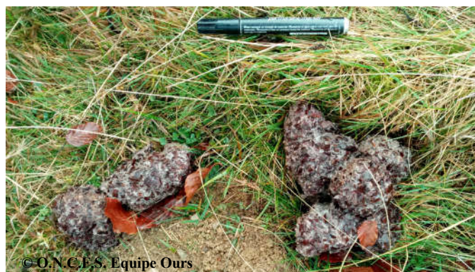
Photo d'une des douze crottes de Goiat, composées uniquement de faines, trouvées sur la commune de Ferrère (65).

Après avoir passé 113 jours consécutifs entre la Haute-Garonne et la partie Est des Hautes-Pyrénées, Goiat s'est installé dans le Val d'Aran. Au vu des faibles déplacements remarquables depuis le 28 novembre, il est très probable qu'il y établisse sa tanière. La grande quantité de faines qu'il a notamment consommée en Barousse, entre les 3 et 14 novembre, devrait lui avoir permis de constituer un « bon manteau de graisse » pour passer l'hiver sereinement.