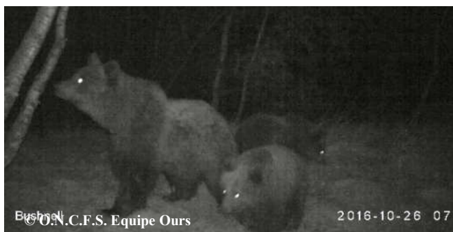
Photo, extraite d'une vidéo automatique, d'une ourse suivie de ses 3 oursons, le 26 octobre 2016 à 07h20, sur la commune de Bonac Irazein (09).

7 séries de photos-vidéos automatiques ont été relevées courant novembre. Les données obtenues ont permis de détecter au moins 10 individus dont Pyros, 1 mâle adulte, 1 individu de taille femelle adulte, 1 femelle suivie de 3 oursons de l'année (photo ci-contre).