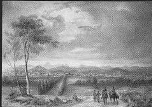
"Ce pays est beau à l'oeil et peu riche et peu communicatif" Vue de Tarbes vers 1830, par Meelling

du mardi au vendredi : 10h - 18h du samedi au dimanche : 10h - 12h / 15h - 18h