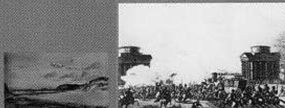
Départ pour la déportation, 12 germinal an III, 1er avril 1795

Rentrant d'exil en 1832, il gagna Tarbes " que pour mon bonheur, je n'aurais jamais dû quitter " dit-il. Il fut alors élu Conseiller Général en 1833, mandat dont il démissionna pour raison de santé en novembre 1839, quelques mois avant sa mort en janvier 1841.