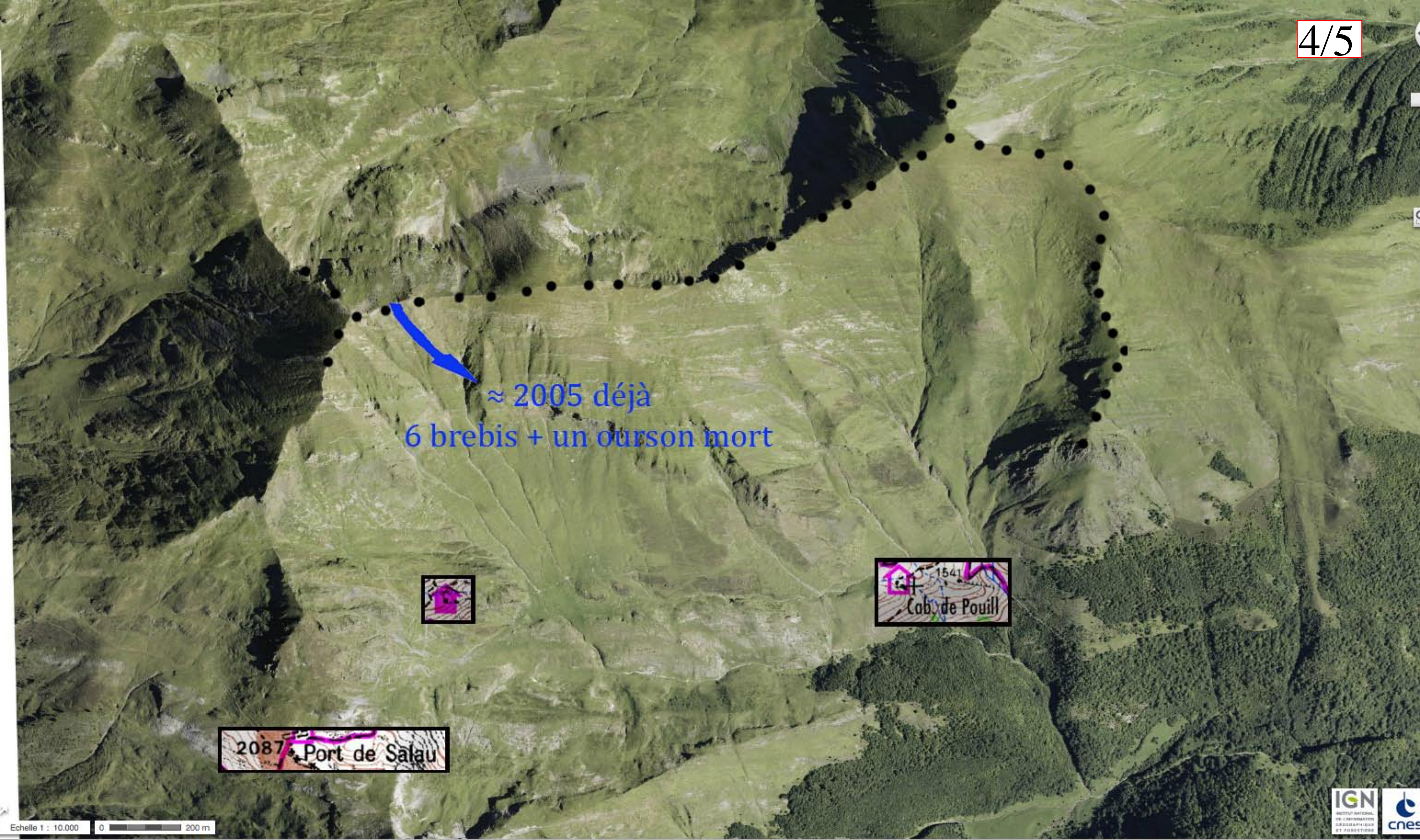
5 - Même endroit en 2005 déjà : 6 brebis + un ourson morts Accès impossible par en haut, très risqué par en bas.