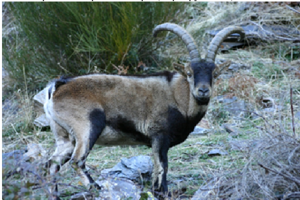
Bouquetin mâle, âge de 11 ans, en palage hivernal. Valdeinfierno, Sierra-Nevada, 23/11/2007.

Photos espèce : Bouquetin ibérique ( Capra pyrenaica )