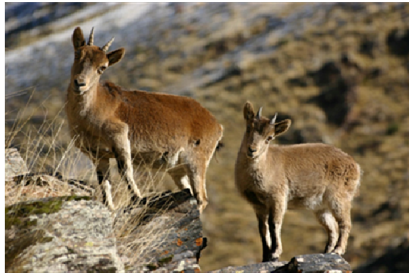
Bouquetin femelle adulte et son cabri âgé de 6 mois. Valdeinfierno, Sierra-Nevada, 23/11/2007.