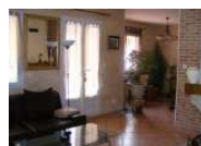
Vente Maisons / Villas