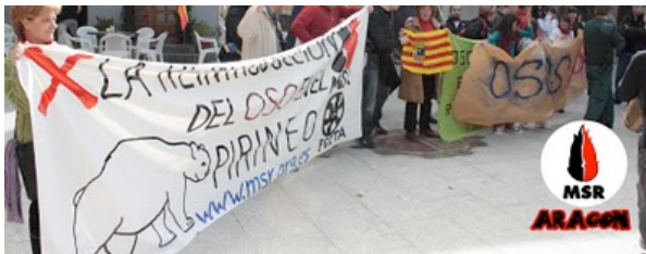
Mandan a críos para que se pongan con una pancarta antioso enfrente nuestro y para robarnos la nuestra