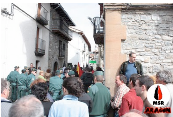
Acaba la concentración