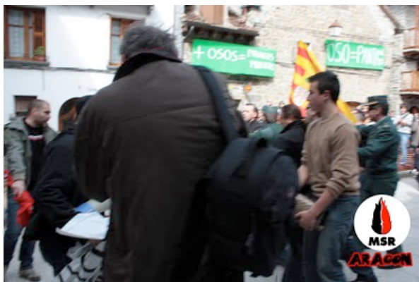
Parte izquierda de la foto: Los militantes del MSR recuperan su pancarta