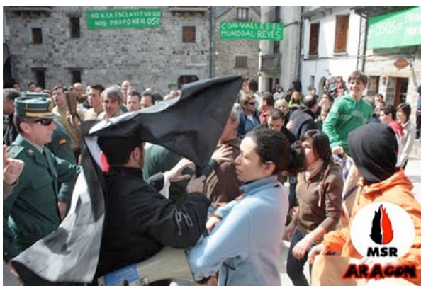
La Llama no se arruga pese a sus ataques