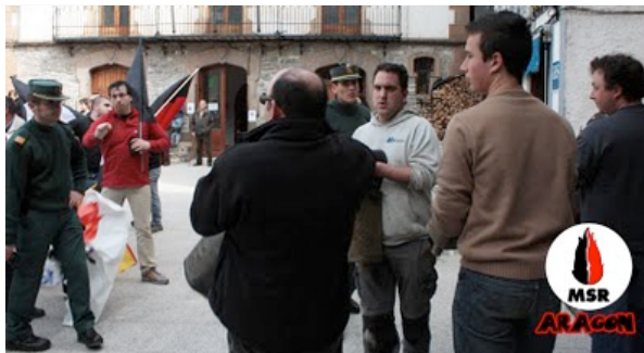
Momento exacto en el que nos quitan la pancarta