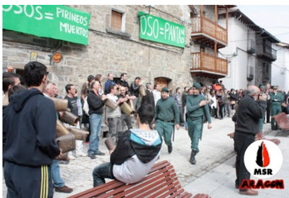
Llegan más guardias civiles