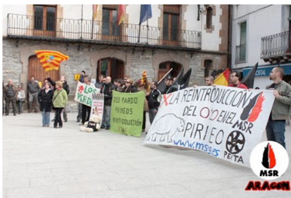
Comienza la concentración