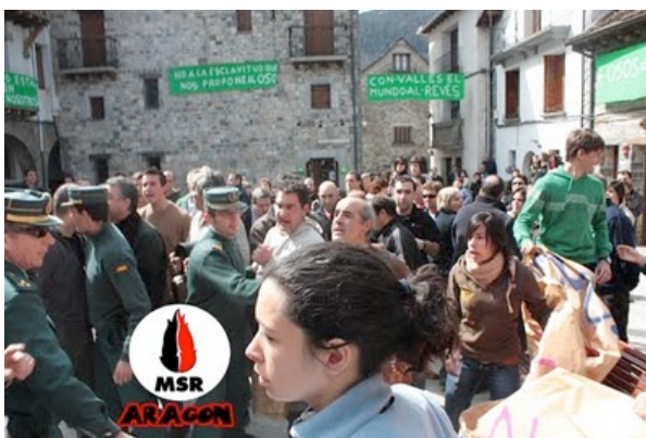
Momentos de tensión después de su enésimo intento de reventarnos la concentración 2