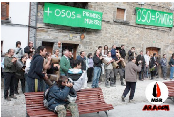
Comienzan a hacer sonar los cencerros para que no nos podamos expresar libremente