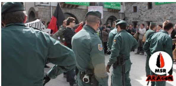
Llegan más efectivos de la guardia civil