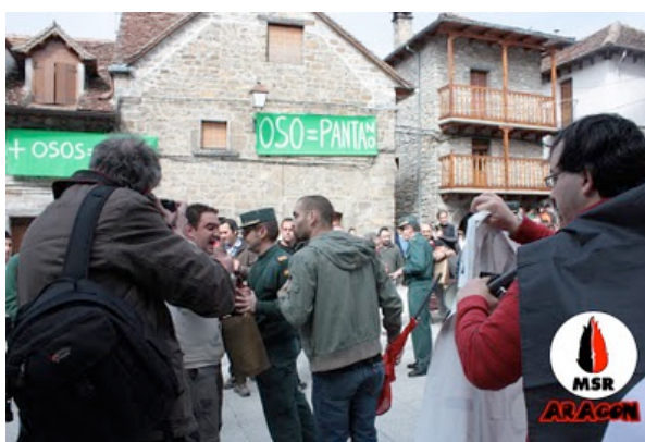
Se nos avalanzan encima