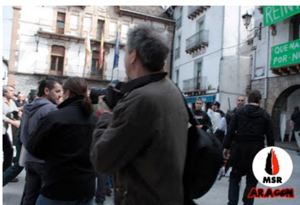
La llama se defiende y recupera su bandera de Aragón