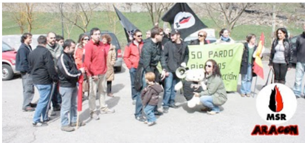
Foto de familia de parte de los integrantes de la manifestación pro oso al acabar el acto