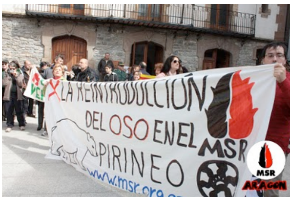
Pancarta del MSR y PECTA