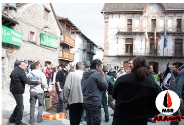
Nos roban una bandera de Aragón