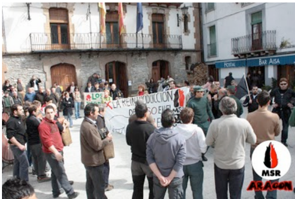
Momentos cortos de tranquilidad