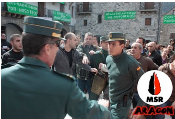
Momentos de tensión después de su enésimo intento de reventarnos la concentración