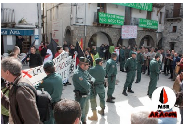
Momentos antes de acabar el acto