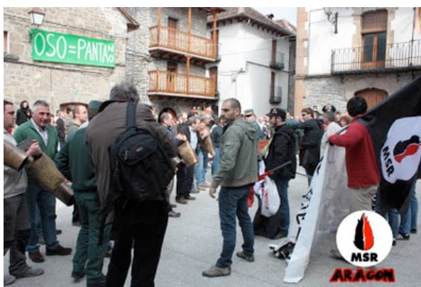
Comienza el acoso y no bajamos la guardia