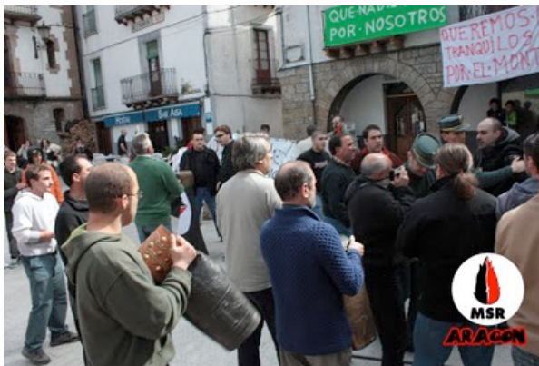
La llama no se arruga nunca