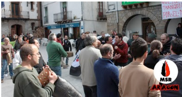
Tensión después de recuperar nuestra bandera aragonesa