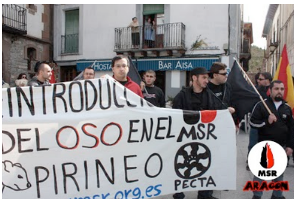
La pancarta semi-rota después del último intento de arrebatar-nos-la