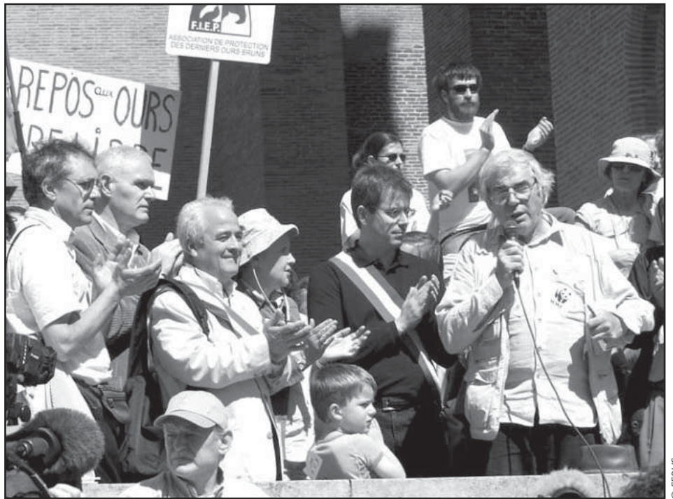
Manifestation pour l'ours à Toulouse en juin 2006, notamment aux côtés des maires d'Arbas et de Luchon