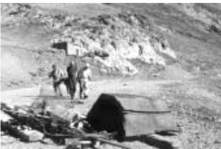
Au col de Sencours