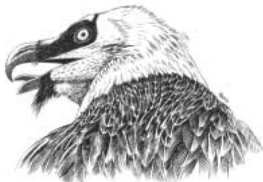
Gypaète par Alexis Nouailhat

Ces quelques propositions ont pour but de montrer que des solutions sont possibles, et qu'elles demandent de la bonne volonté de la part de tous, et une volonté commune de rechercher la conciliation. ■