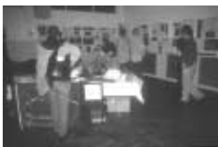
Notre stand à Limonest