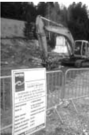
Démontage de la gare de St Nizier

gare, prise par Antoine Van Limburg, a été abondamment commentée par les visiteurs de notre exposition à Naturissima et à Autrans, les visiteurs étant persuadés que tout avait été démonté. Hasard ou coïncidence, la Commune a rasé cette gare dans les premiers jours de 2003. Nous félicitons la commune de cette heureuse initiative qui, nous l'espérons, sera suivie d'autres projets de nettoyage. Tremplin des jeux olympiques, rampes d'éclairage des 3 pucelles, téléskis abandonnés au village... la commune a l'embaras du choix. ■