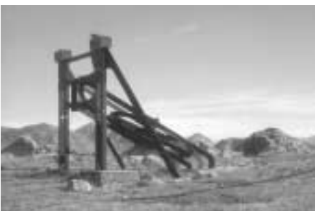
Ancienne infrastructure de treuillage dans le Briançonnais

Le Centre Permanent d'Initiatives pour l'Environnement de Haute-Durance, association au service du développement local, est intervenu à plusieurs reprises dès 1994 sur des chantiers de nettoyage des sites pollués par des matériaux datant du dernier conflit mondial. Un inventaire avait permis de cibler les sites prioritaires sur lesquels devaient être menées des actions de nettoyage.