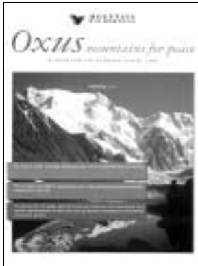
Plaquette de présentation du projet

Mountain Wilderness International a décidé de lancer, au cours de l'année 2003, un projet favorisant le retour du tourisme et des activités sportives liées à la pratique de l'alpinisme ou de la randonnée dans les vallées afghanes de l'Hindou Kouch et du Pamir. Cette initiative limitée, volontairement réaliste et concrète, s'articule autour de trois points :