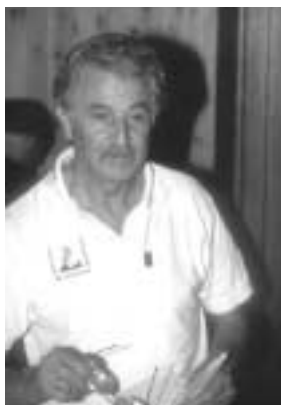
J. Sicart © V. Neirinck

A cette occasion, nous vous proposons ici de mieux le connaître.