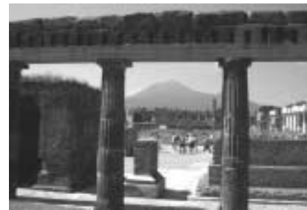
Le Vésuve depuis Pompeï