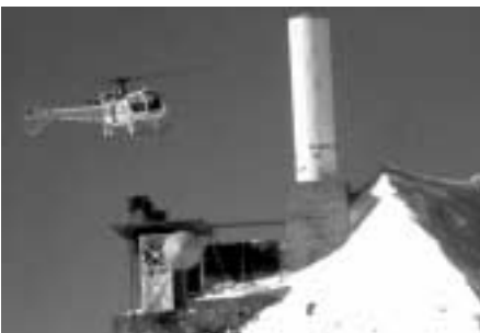
Le relais radio de Tré la Tête aujourd'hui démonté