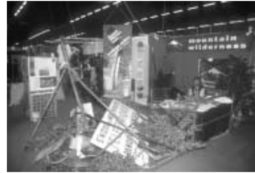
Le stand MW à Naturissima

Nous espérons que le stand de Naturissima laissera quelques souvenirs aux visiteurs autant qu'il en laissera à ceux qui l'ont monté et animé. L'installation sur notre stand de restes d'aménagements obsolètes, la réalisation d'une exposition photographique sur cette campagne qui prend fin : une belle entreprise qui nous a donné du