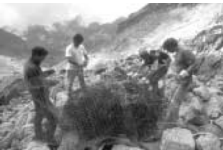
Nettoyage dans le Mercantour

Mountain Wilderness a donné l'exemple en agissant sur le terrain :