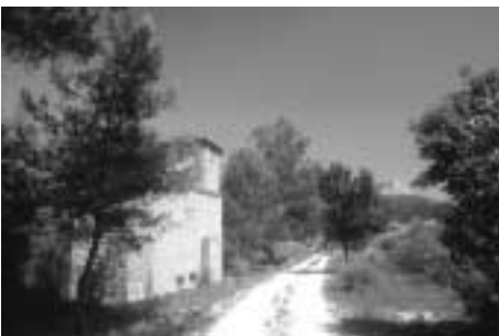
Sainte-Victoire, l'un des sites bientôt nettoyé