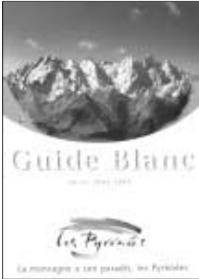
Dépliant publicitaire de la Confédération pyrénéenne du tourisme

La folie des nouveaux aménagements, canons à neige et extensions de stations de ski sévit aussi dans les Pyrénées. Certes, comparé aux Alpes, cela peut paraître anodin, mais à l'échelle de notre massif, ce ne l'est plus.