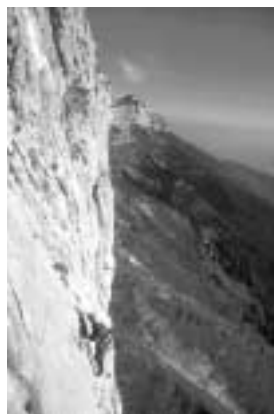
Rochers du Midi, voie de la Grotte, en Chartreuse

En réaction au rééquipement sauvage de plusieurs voies historiques dans les massifs du Vercors et de la Chartreuse, un groupe de grimpeurs s'est récemment constitué afin de promouvoir l'escalade en terrain d'aventure, ou escalade traditionnelle (1) : Initiative Terrain d'Aventure. Mountain Wilderness, incontestablement proche de cette initiative, leur a laissé la parole.