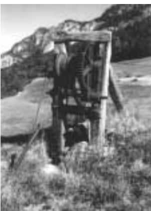
Treuil du câble de la Grande Blache

Nous souhaitons que notre travail incite les acteurs locaux et nationaux à réagir et traiter le problème dans une diversité d'approche : réhabilitation et valorisation de ce qui entre dans notre patrimoine culturel, conversion intelligente, ou simple démontage pour les nombreuses ruines qui donnent aux habitants et aux visiteurs de tous horizons, une image déplorable de notre relation à la montagne. ■