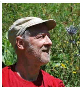
Yves Paccalet © Radio France

20 mai 2015 | Catégorie : Actus de Ferus , Actus en France , Actus loup , Actus lynx , Actus ours , Toute l'actualité