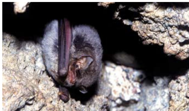
■ Le Minioptère de Schreibers ( Miniopterus schreibersii ), classé "Vulnérable"