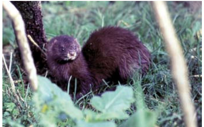
■ Le Vison d'Europe ( Mustela lutreola ), une espèce classée "En danger"

De plus, des évaluations complémentaires ont été réalisées pour certaines sous-espèces continentales et pour certaines populations d'espèces marines (cf. tableau p.11).