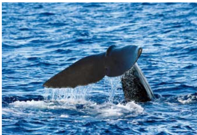
■ Le Cachalot ( Physeter macrocephalus ), une espèce "Vulnérable"

Concernant les cétacés, près de la moitié des espèces a dû être placée dans la catégorie "Données insuffisantes", en raison du manque de connaissances et de données disponibles. Pourtant, certains de ces mammifères marins pourraient bien être menacés en France, car ils sont affectés par de multiples