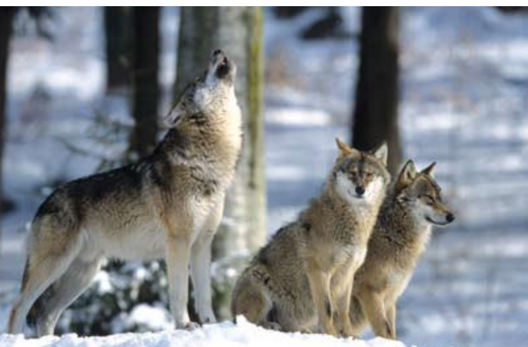
■ Le Loup gris ( Canis lupus ), une espèce classée "Vulnérable"

Malgré la situation encore préoccupante de plusieurs espèces, le résultat des évaluations montre que les actions de conservation entreprises pour les mammifères sur le territoire métropolitain portent leurs fruits (protection réglementaire nationale et européenne, plans nationaux d'action, conservation des habitats naturels...). Ces résultats encourageants incitent à poursuivre les efforts et à renforcer l'action pour continuer à améliorer, dans les années à venir, la situation de ces espèces.