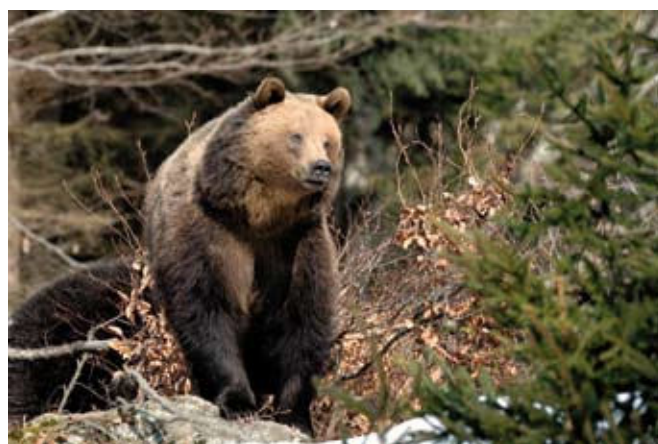
■ L'Ours brun ( Ursus arctos ), classé "En danger critique d'extinction"

NE : Non évaluée (espèce non encore confrontée aux critères de la Liste rouge)