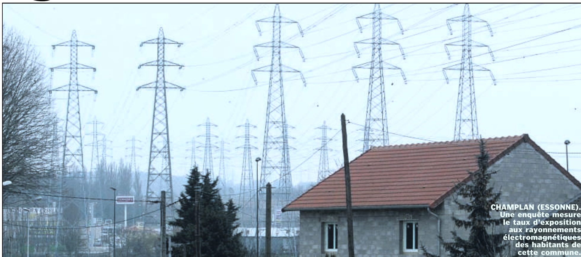
CHAMPLAN (ESSONNE). Une enquête mesure le taux d'exposition aux rayonnements électromagnétiques des habitants de cette commune.