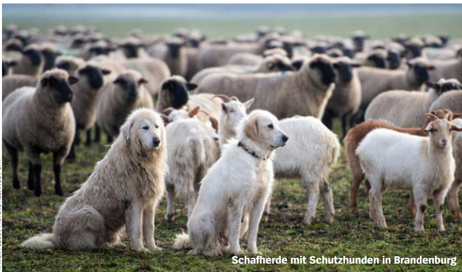
Schafherde mit Schutzhunden in Brandenburg