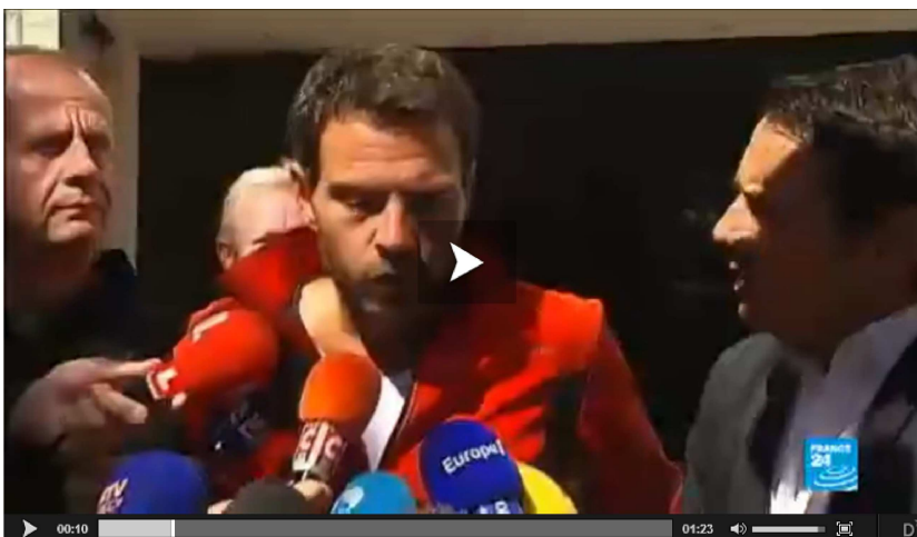
Plus d'actualités en vidéo - Jérôme Kerviel continue de braver les autorités françi