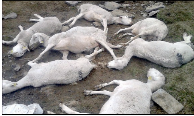
Les brebis étouffées