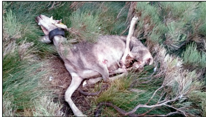
Une brebis morte après avoir été attaquée par l'ours.