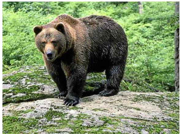
FOTO: La iniciativa persigue garantizar la supervivencia de la especie en Aragón y Navarra.