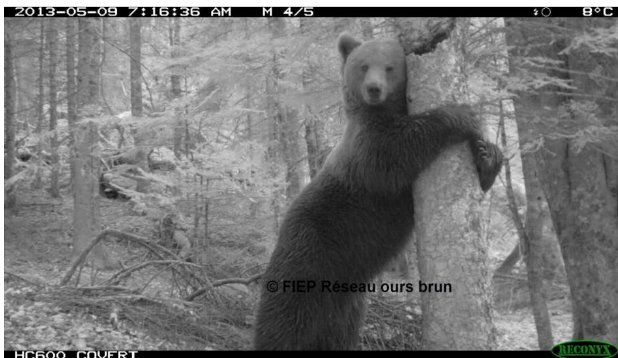
Ours brun en Béarn le 9 mai 2014