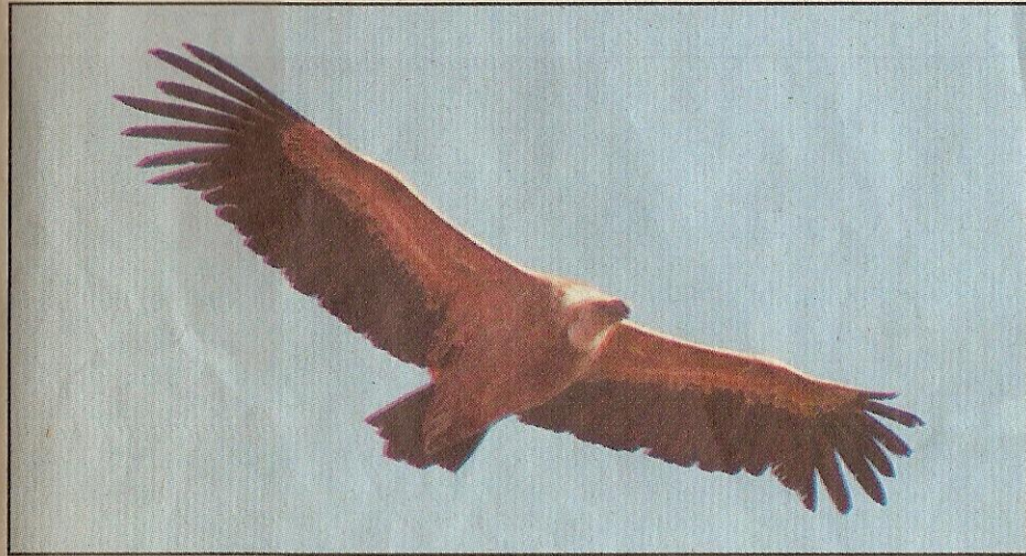
Des vautours qui attaquent des moutons: une scène inhabituelle. LDD

CHAMPÉRY ► Des rapaces auraient attaqué un troupeau de moutons à Barme. Avec une tactique mortellement efficace: piquer l'arrière du troupeau pour précipiter les bêtes à l'avant dans le vide. Six victimes et des questions.